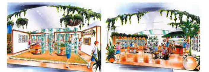
フラワー発見ギャラリー