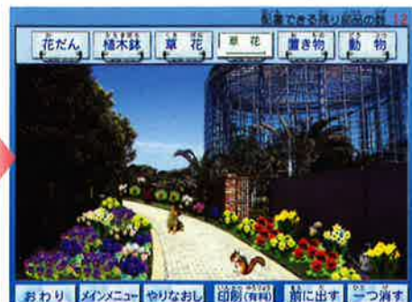
あなただけのお庭のできあがり。

2階にある「クイズ館」は、季節ごとに替わる植物のクイズに挑戦できます。たとえば、「アサガオは何科?」や、「万葉集にでてくる“つきさ”の現代名は?」など、簡単なものから難しい問題まで出題されます。「お正月に鏡餅と一緒に飾る葉は?」という生活の中で利用されている植物からの出題もあります。三者択一式で、一題ごとにわかりやすい解説がでますので、できても、できなくても、なるほどと納得。そして、最後には得点もでます。手軽に楽しめる「クイズ館」で、腕試しをしてみませんか。さて、あなたは何点とれるかな。