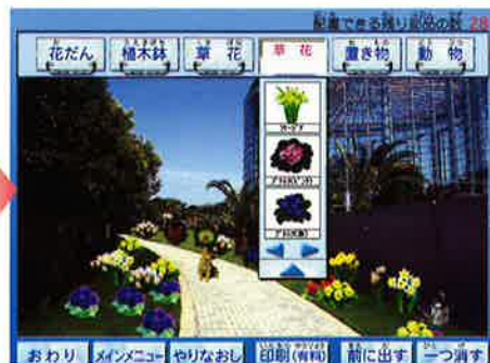
お好きな花々などを配置すれば...

芝生の庭の奥には緑の木を植えて、その手前に真赤な花、庭の真ん中には真っ白な噴水をおいて、まわりで犬が遊ぶ...そんな光景を描いてみたり、庭中白い花をあしらっ