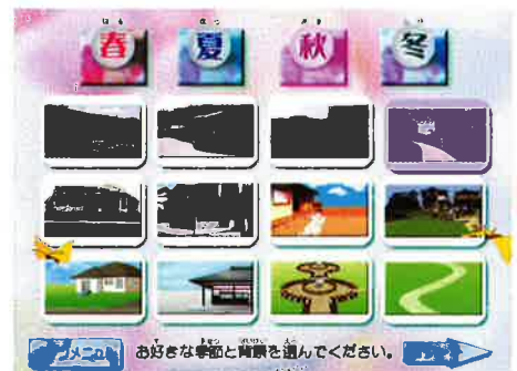
「花だんづくり」お好みの季節と背景を選んで...