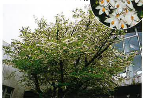
白い花を咲かせたエゴノキ

また、回りを見渡すと目に入るのが、壁面に飾られた色とりどりのハンギングバスケットです。ハンギングバスケットは、「空中を彩る小さな花壇」といったようなもので、空間を上手に利用して、より立体的で量感のある花飾りのポイントになるものです。狭いスペースでも花を飾ることができるので最近特に人気があり、いろいろなタイプのものが手に入るようになりました。花の美術館では、大小のバスケットを組み合わせ、変化と彩りをつけるように工夫しています。ハンギングバ