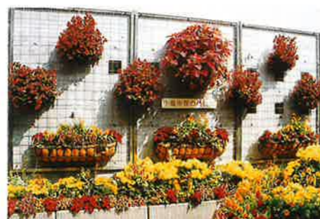
ハンギングバスケットで飾られた壁面

また、回りを見渡すと目に入るのが、壁面に飾られた色とりどりのハンギングバスケットです。ハンギングバスケットは、「空中を彩る小さな花壇」といったようなもので、空間を上手に利用して、より立体的で量感のある花飾りのポイントになるものです。狭いスペースでも花を飾ることができるので最近特に人気があり、いろいろなタイプのものが手に入るようになりました。花の美術館では、大小のバスケットを組み合わせ、変化と彩りをつけるように工夫しています。ハンギングバ