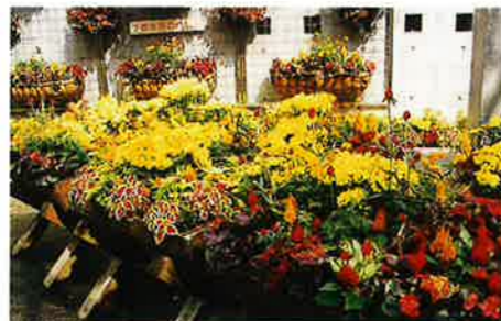
華やかな寄せ植え(秋)

また、光庭では、季節によって植物企画展を開催しています。植物企画展は、パンジーやラベンダーなど、ひとつの植物に着目して品種の展示を行なうものです。春のパンジー展、初夏のラベンダー&ハーブ展、夏の食虫植物・多肉植物展、秋のサルビア展など、年間を通じてさまざまな植物をご覧いただけます。こんなにもいろいろな種類や品種があるのかと、そのバラエティの多さに驚かれる