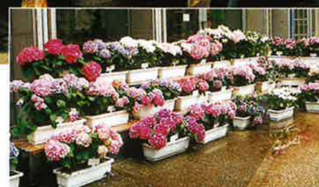
植物企画展「アジサイ展」(5月)