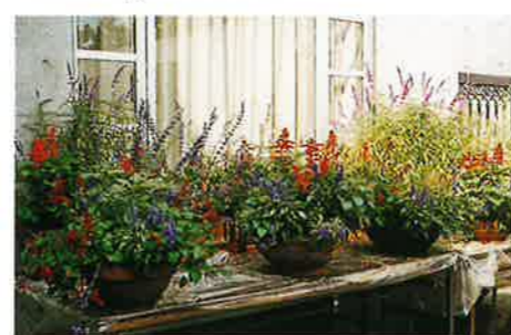
植物企画展「サルビア展」(10月)