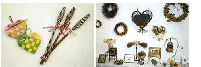
ラベンダー「スティック」と「サシェ」