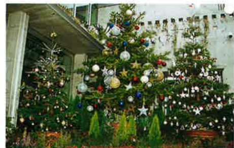
大きなクリスマスツリー(12月)