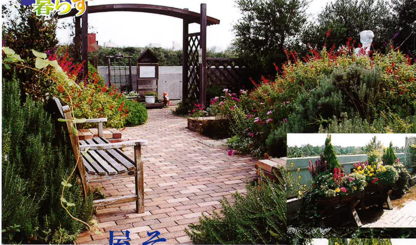
ペレニアルガーデン