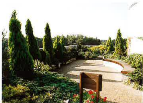
コニファーガーデン