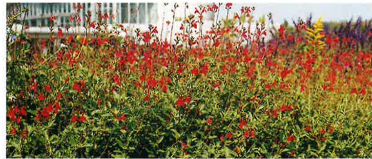
チェリーセージ(6~7月)

花壇⑥・⑦は、ハーブを用途ごとに分けて植えた見本園です。花壇⑥は、染色用・薬用として利用できるハーブを、花壇⑦は、食