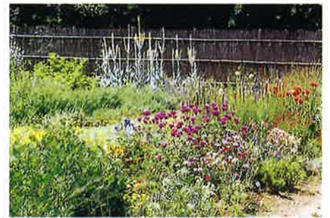
デイリリー、ベルガモット、マーレイン(7月上旬)

ハーブガーデンは、6つの花壇で構成されています。最も広い面積を持つ花壇⑤は、花の美しいハーブを中心に、さまざまな宿根草を集めた宿根草花壇です。中心に芝生の道が通り、両側に花を見ながら歩くことができます。季節によって咲く花の種類が違うので、季節感を感じられる花壇です。また、花や草姿が可憐なものも多く、模様花壇とはまた異なった自然風的美しさが楽しめます。