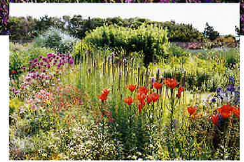
デイリリー(7月上旬)